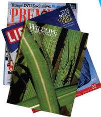
Catálogos y revistas elegantes