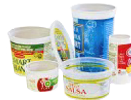
Vasos y recipientes de plástico