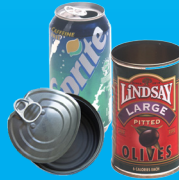
Latas de metal