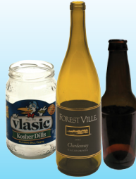
Botellas y frascos de vidrio