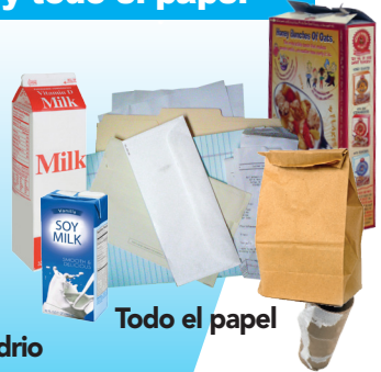
Todo el papel