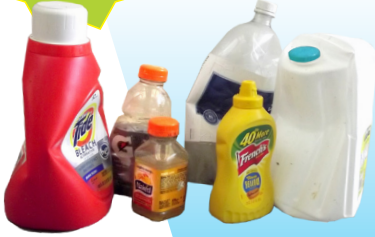
Botellas y jarros de plástico

botellas, latas, tarros, frascos y todo el papel